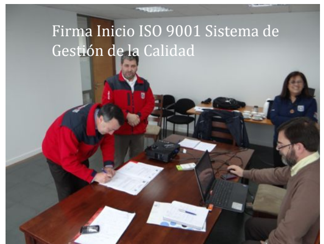
Firma Inicio ISO 9001 Sistema de Gestión de la Calidad