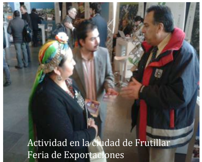
Actividad en la ciudad de Frutillar Feria de Exportaciones