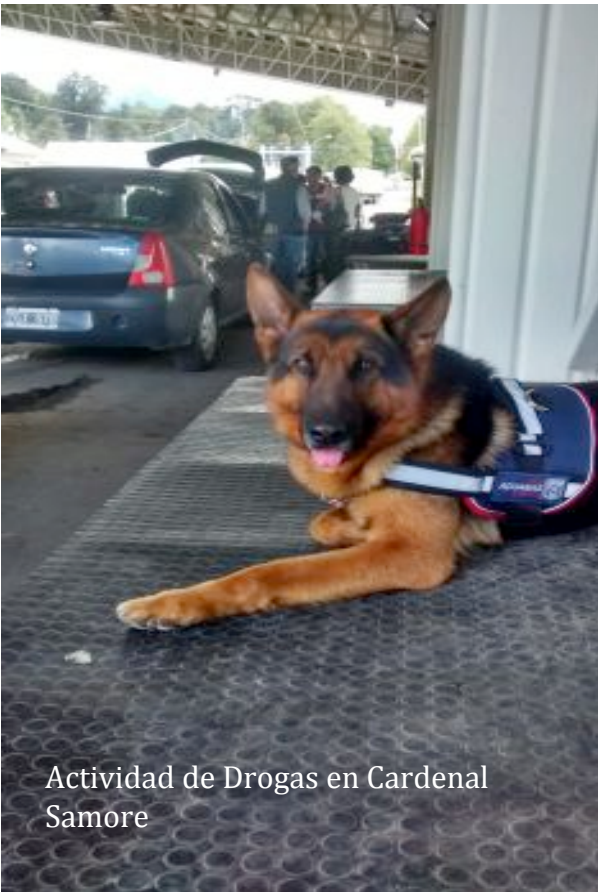
Actividad de Drogas en Cardenal Samore