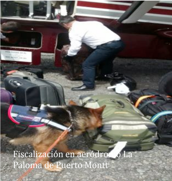
Fiscalización en aeródromo La Paloma de Puerto Montt