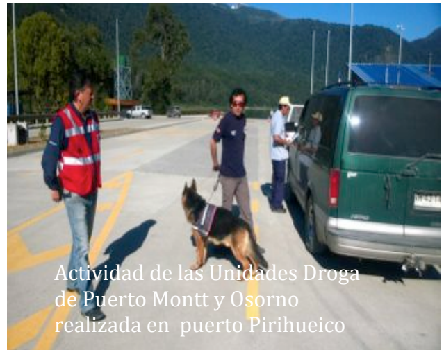
Actividad de las Unidades Droga de Puerto Montt y Osorno realizada en puerto Pihueico