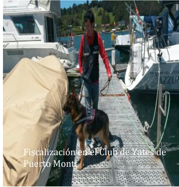
Fiscalización en el Club de Yates de Puerto Montt