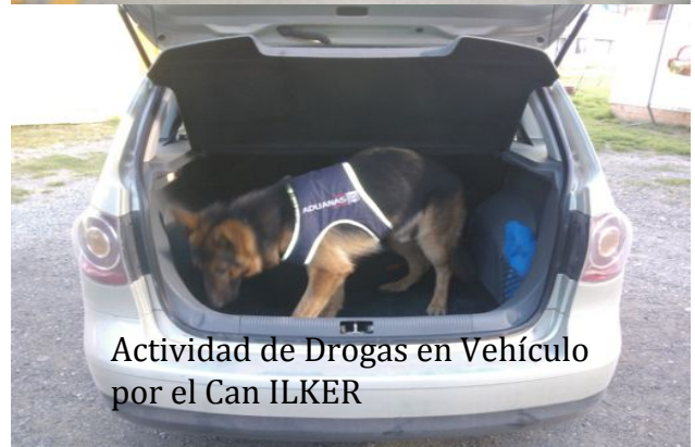
Actividad de Drogas en Vehículo por el Can ILKER