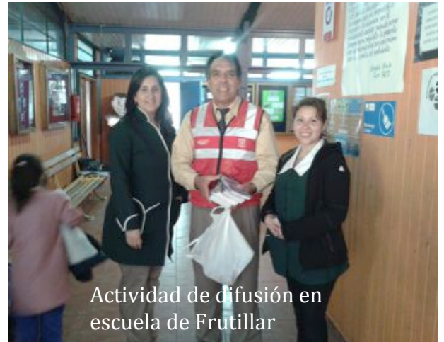
Actividad de difusión en escuela de Frutillar