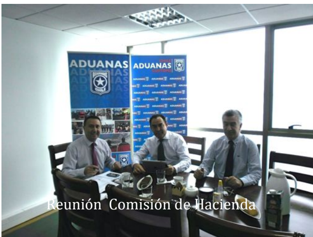
Reunión Comisión de Hacienda