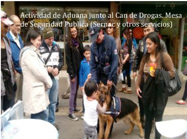
Actividad de Aduana junto al Can de Drogas. Mesa de Seguridad Pública (Sernac y otros servicios)