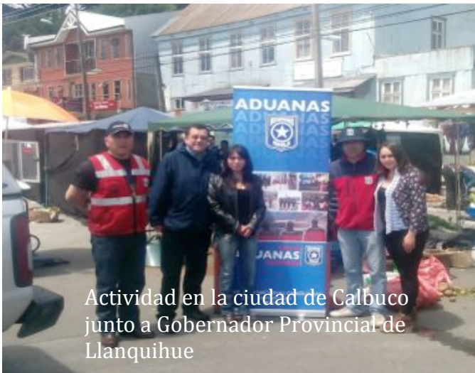
Actividad en la ciudad de Calbuco junto a Gobernador Provincial de Llanquihue