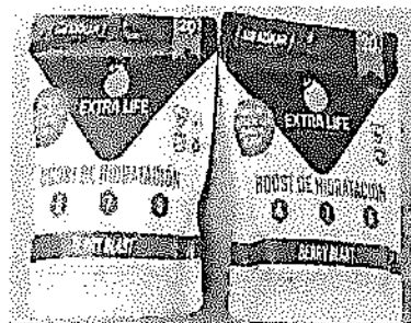
Imagen N° 1

Las dos muestras analizadas se presentan en envase original, sachet de 300 g contenido neto, conteniendo en su interior 20 sachets de 15 g cada uno, rotulados como "Boost de Hidratación, Extra Life", ingredientes (alulosa, citrato de sodio, ácido cítrico, aspartato de magnesio, citrato de potasio, fosfato dipotásico, aspartato de calcio, sal comestible, saborizante idéntico al natural frutos rojos, dióxido de silicio, vitamina C (ácido ascórbico), sucralosa, vitamina B3 (nicotinamida), vitamina B5 (D-pantotenato de calcio), vitamina B6 (clorhidrato de piridoxina), vitamina B12 (cobalamina) y glicinato de zinc), lote, información nutricional, instrucciones de uso, entre otros, conteniendo en el interior un producto en polvo de granulometría homogénea, color blanco.